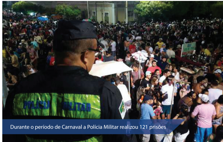
Durante o período de Carnaval a Polícia Militar realizou 121 prisões

dias de folia, o Centro Integrado de Comando e Controle Móvel (CIC-CM) para o município de Caicó, que ficou no 6º Batalhão da Polícia Militar. Este ano, a cidade também iniciou o Gabinete de Gestão Integrada (GGI) que proporcionou um planejamento das ações de segurança pública no município de maneira mais articulada com todos os atores. Em Natal, a Plataforma de Observação Elevada (POE) foi instalada no bairro de Ponta Negra, durante todos os dias de carnaval.