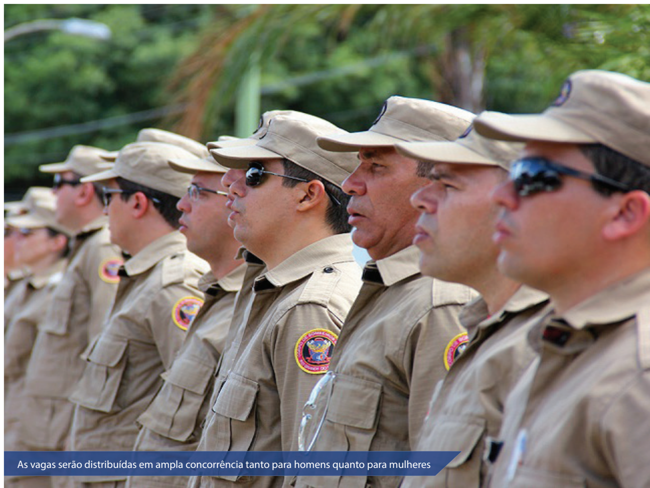
As vagas serão distribuídas em ampla concorrência tanto para homens quanto para mulheres

O salário inicial é de R$ 2.904,00, podendo chegar, nos termos da legislação pertinente às promoções referentes ao quadro de praças, a R$ 9.472,65, subsídio correspondente ao cargo de Subtenente Nível X. O concurso público terá validade de dois anos, podendo ser prorrogado por igual período.