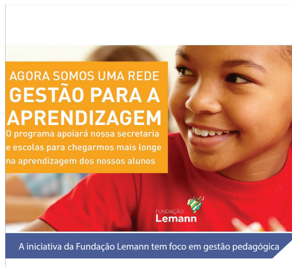
A iniciativa da Fundação Lemann tem foco em gestão pedagógica

O objetivo do Gestão para a Aprendizagem é ter impacto na sala de aula e nos resultados de aprendizagem: "Como o programa envolve desde os profissionais da Secretaria de Educação até os diretores, coordenadores pedagógicos e professores, a atuação dos nossos consulto-