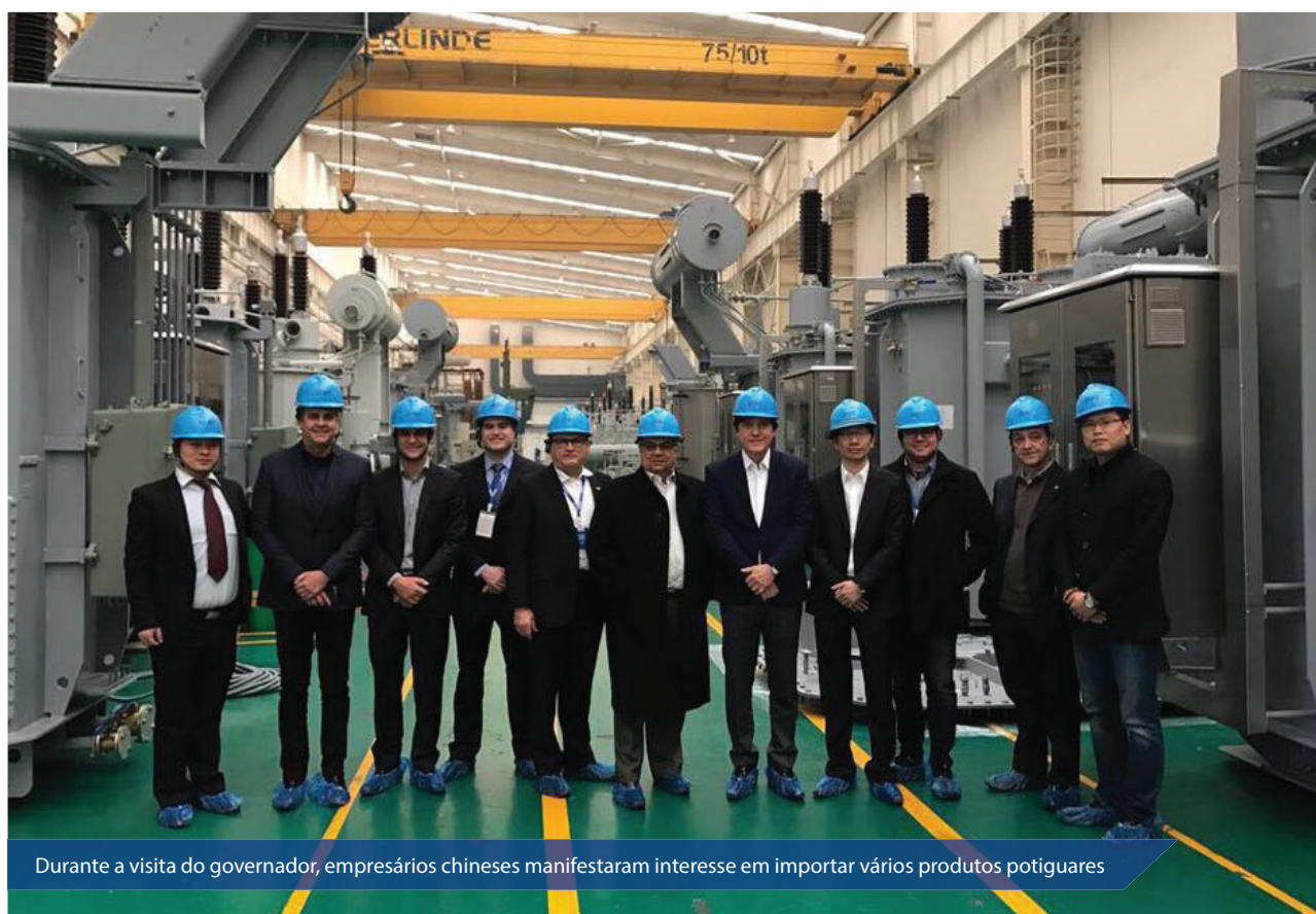
Durante a visita do governador, empresários chineses manifestaram interesse em importar vários produtos potiguares

O governador Robinson Faria e a comitiva potiguar, que o acompanha na missão comercial na China, visitaram o Parque Nacional de Alta Tecnologia Industrial de Suzhou, cidade com cerca de 6 milhões de habitantes e uma das grandes potências daquele país. Na região está localizada uma Zona de Processamento de Exportação que junto com outras zonas econômicas especiais viabilizaram a arrancada da produção industrial na China.